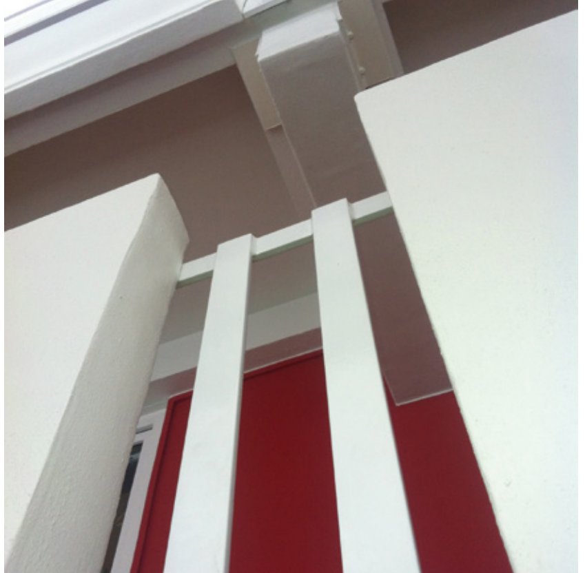
Konsolen und Brüstungselemente

Die Wetterschalen wurden mit einer 12 cm minera- lischen Dämmung gedämmt und anschließend ver- putzt. Die sich im 1.OG befindliche Terrasse wurde instand gesetzt und erhielt eine neue Abdichtung und ein neues Geländer. Die Giebelseiten des Gebäudes sind bereits gedämmt gewesen und erhielten aus die- sem Grund nur einen Überholungsanstrich.