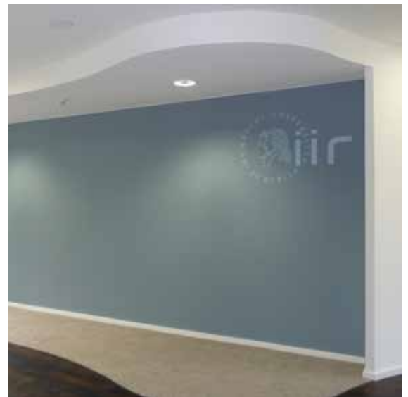
Abb. 1.: Innenwand mit Firmenlogo

Nach dem Umbau standen den Mietern neben den Büro- und Flurbereichen auch eine Empfangs- und Wartezone, ein Serverraum sowie ein Bibliotheksbereich zur Verfügung.