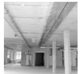
Abb. 2.: leere Büroeinheit (Bestandssituation)